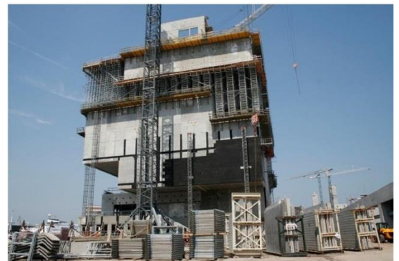
Anvers - MAS (Neutelings Riedijk Architecten)