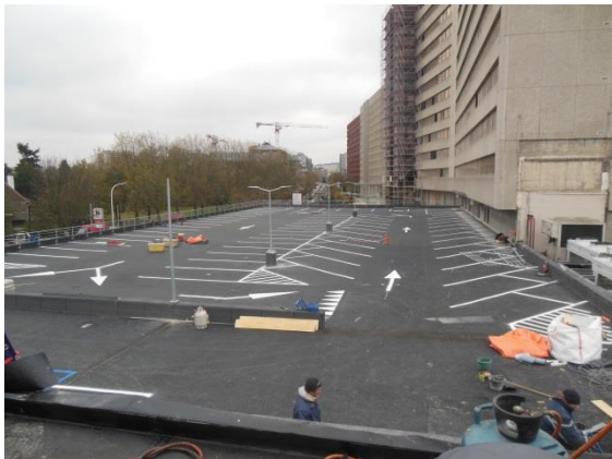
Evere, Delhaize, Leopold III

Een samenwerking op dit niveau is voor ons geslaagd wanneer we een ontwerp kunnen vertalen in een bouwtechnisch goed gebouw dat budgettair haalbaar is.