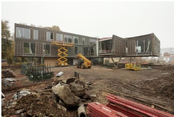
Montigny-le-Tilleul - Maison communale (bureau Vers plus de bien être)